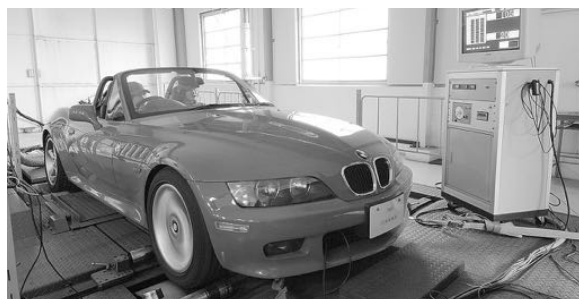
時速200kmまで測定できる走行実験装置 (BMW)