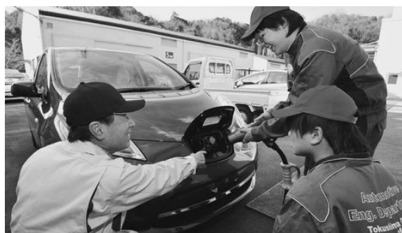
電気自動車 (LEAF) の整備 (NISSAN)