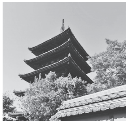
伝統と学問の街「京都」で カレッジライフを満喫しよう!