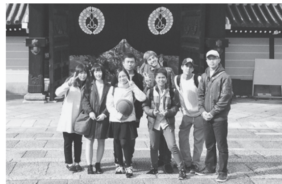
日本文化とマナーの授業でお寺を見学

卒業までの間に日本語能力試験N1に合格し、大学に編入して経済を勉強したいと思っています。それが、私の今の目標です。