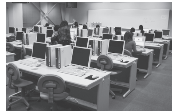
ズラリと並んだパソコン。授業以外にも利用できます。